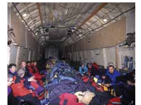
Mit dem Frachtflugzeug ins Herzen der Antarktis.

Langsam, aber sicher werden wir ungeduldig. Schliesslich entscheidet die Expeditionsleitung den Flug mit einer Iljuschin 76 zu wagen. Diese riesige russische Frachtmaschine mit einem Startgewicht von über 210 Tonnen wird normalerweise nur für