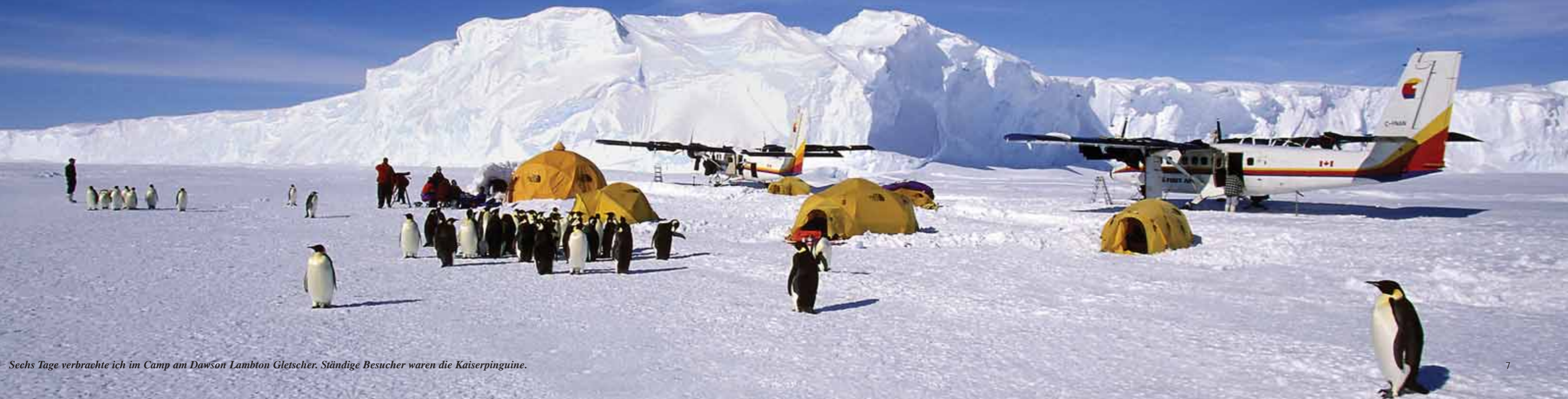
Sechs Tage verbrachte ich im Camp am Dawson Lambton Gletscher. Ständige Besucher waren die Kaiserpinguine.