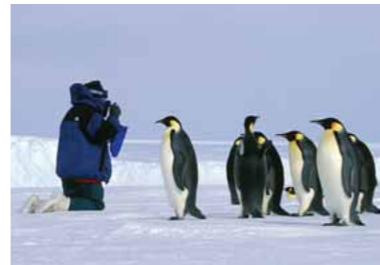
Aug in Aug mit den Pinguinen.

Seit Tagen schon werden Fässer voll Flug-