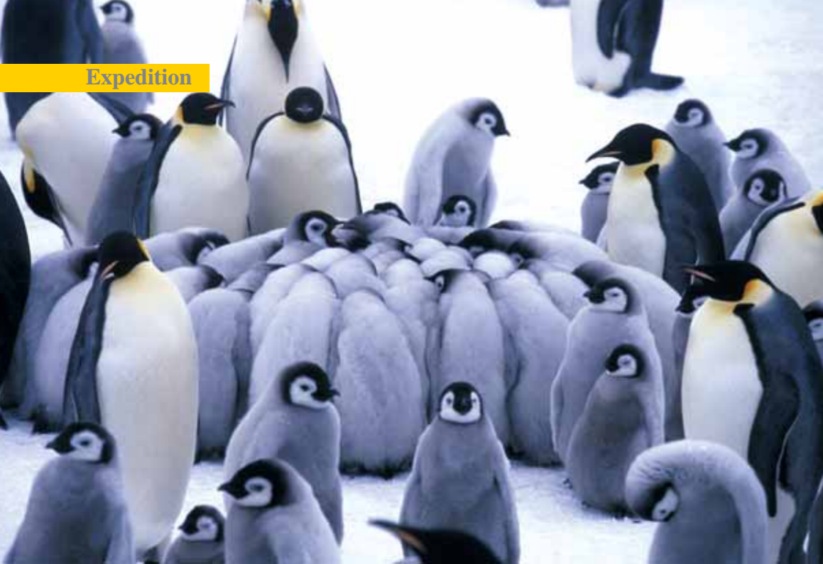
Oben: «Kindergarten» der jungen Pinguine. Das Zusammenrücken bietet Schutz vor Sturm und Kälte.