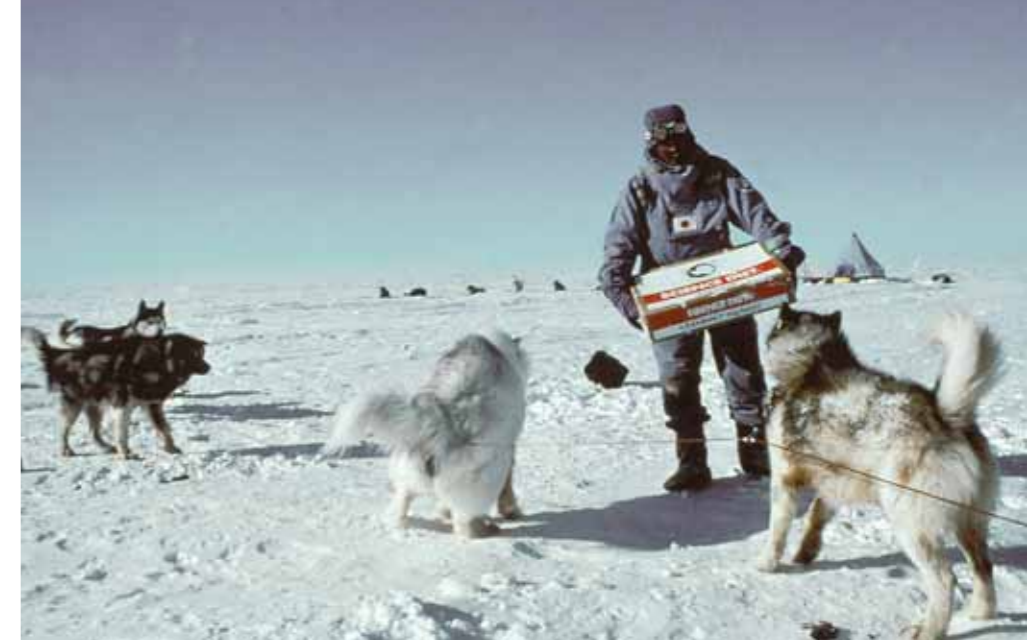
Auf der 221 Tage dauernden Expedition wurden 6'500 Kilometer zurückgelegt. Äusserst wichtig war dabei die Ernährung von Mensch und Tier.

Die Transantarktis-Expedition war wahrscheinlich die längste Polarexpedition der jüngeren Zeit. Sie hat vom Start bis zum Ziel 221 Tage gedauert. Wir haben die Antarktis von Westen nach Osten durchquert und dabei