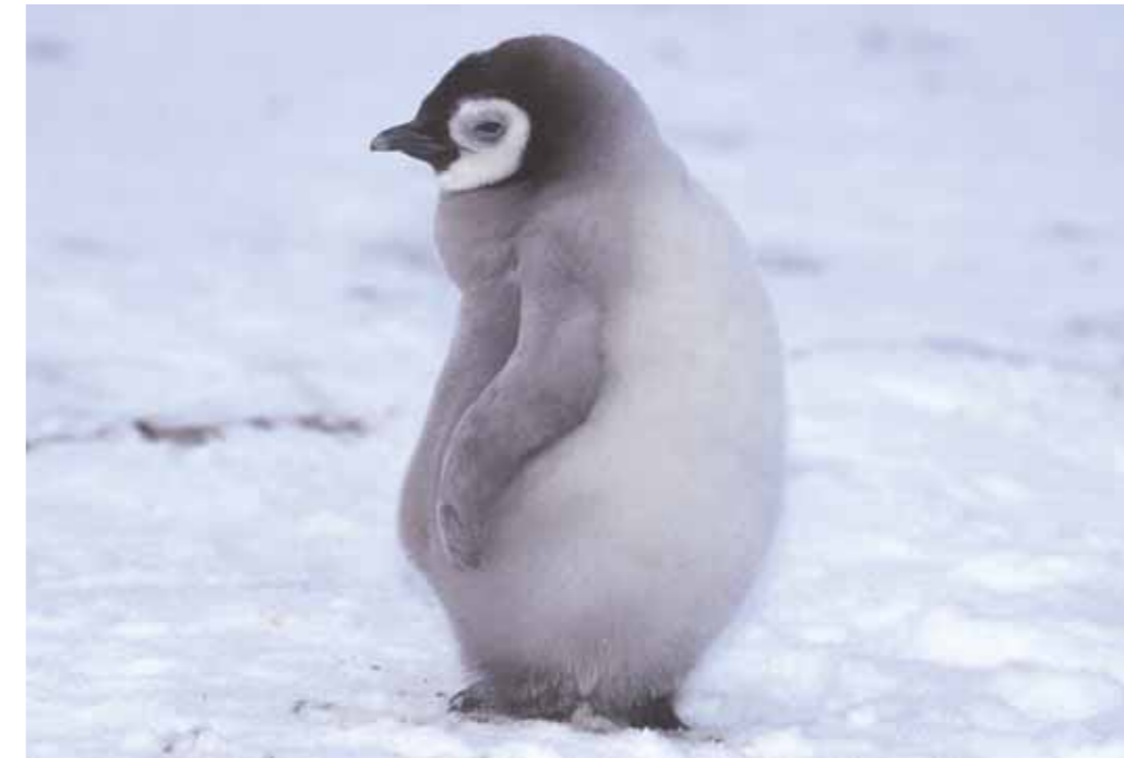
Wann kommt Mami endlich vom Fischfang zurück

Die beste Zeit zum Fotografieren ist zwischen 20 und 5 Uhr, wenn das Licht weich erstrahlt und lange Schatten wirft. Dann ist es besonders schön, auf dem Bauch zu liegen und den Pinguinen zuzusehen. Ich belichte insgesamt 245 Filme in der Hoffnung, viele gute Aufnahmen darunter zu haben, denn wer weiss, wann ich das nächste Mal hierher kommen werde...! Die jungen Kaiserpinguine sind besonders neugierig. Sie kommen nahe an uns heran, weil sie spüren, dass wir ihre Freunde sind. Manchmal nähern sie sich so nah dem Objektiv meiner Kamera, dass ich kaum noch auslösen kann. «Unsere» Kolonie umfasst etwa 9000 Tiere. Oft legen die Elterntiere auf der Futtersuche mehrere hundert Kilometer zurück. Teils auf den Füßen, teils auf dem Bauch rutschend, überwinden sie die grosse Distanz. Zurück in der Kolonie und den Kropf voll Futter, erkennen sie ihr Junges unter Tausenden an der Stimme wieder. Mein Besuch bei den Kaiserpinguinen gehört zu den bewegendsten Erlebnissen als Fotograf und Polarfan. Wenn ich heute an die Aufnahmen im Sturm denke, komme ich immer noch sofort ins