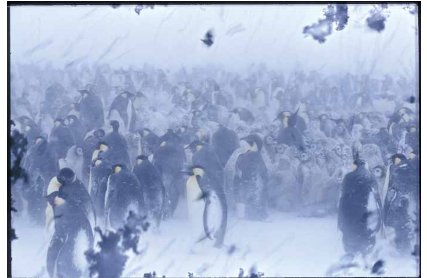
Extreme im Sturm; minus 30 Grad Celsius, Sturmböen mit über 100 km/h und Eiskristalle im Innern der Kamera nach dem Filmwechsel ergaben dieses spezielle Foto.

dass wir gutes Flugwetter erwarten können. Also wird gepackt und alles wieder in unsere zwei Flugzeuge verstaut. Kurze Zeit später sind wir bereits in der Luft. Zuerst ist der Himmel bedeckt, aber die Satelliten-