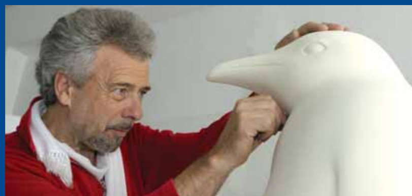
Pinguin trifft .... Das Geheimnis wird am 23. Mai 2005 am Zürcher Paradeplatz gelüftet.